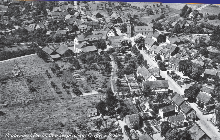
Drabenderhöhe im Oberbergischen. Fliegeraufnahme

Drabenderhöhe ist eine Ortschaft der Stadt Wiehl mit 3398 Einwohnern (2015). Wie der Name schon verrät, liegt das Dorf auf einem Höhenzug in exponierter Lage in schöner landschaftlicher Umgebung. Drabenderhöhe am Kreuzungspunkt zweier historischer Fernwege, der Brüderstraße und der Zeithstraße gelegen, hat eine lange geschichtliche Tradition und wurde 1353 erstmals in einer Urkunde als "Drauender Hoy" (gelesen als: Dravender Hoh) erwähnt. Über mehrere Jahrhunderte stritten sich der Herzog von Berg und die beiden Grafenhäuser von Sayn und zu Wittgenstein um die Zugehörigkeit der aus dem Mittelalter stammenden Kapelle bis beide Adelshäuser sich 1604 endgültig darüber einigten, dass Drabenderhöhe zur Reichsherrschaft Homburg gehören sollte. Nach Auflösung der Herrschaft durch die Franzosen wurde Drabenderhöhe 1808 eine eigene politische Gemeinde. Aufgrund der Grenzlage konnte sich der Ort nicht weiterentwickeln und blieb ein kleines Kirchdorf reformierten Bekenntnis mit zentraler Funktion für die Nachbargemeinden Anfang, Brächen, Büddelhagen, Dahl, Forst, Hahn mit Hähner Mühle, Hillerscheid, Immen, Jennecken, Niederhof, dem alten Pfarrhof Pfaffenscheid, Obermiebach mit Miebacher Mühle, Scheidt, Verr und den links der Wiehl gelegenen Weiershagener Höfen Auf der Linde, Bergerhof, Fürberich, In den Weiden, Kleebornen mit Kleeborner Mühle, Mühlen an der Wiehl, Reuschenbach und Zur Hardt.